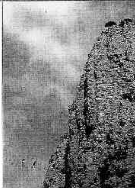
Via ferrata typique quand on est arrivé là, plus de porte de sortie, il faut obligatoirement rejoindre les arbres tout là-haut.