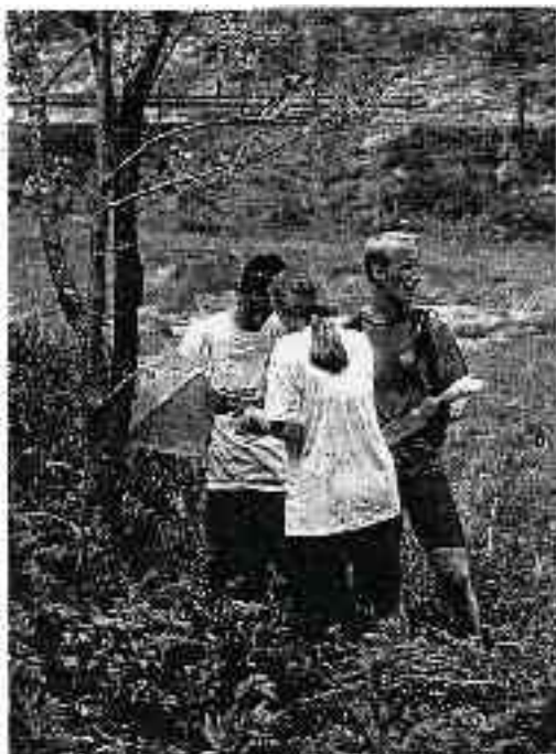
Et une belle nuit de plus. La salvanie, c'est par où ?

en raccourcissant les manches de fourchettes et de brosses à dents et en remplaçant la serviette de bain par une petite serpillière éponge - profiter du vent pour orienter la tente de manière à ce qu'il sèche l'intérieur condensation oblige), mais sinon, se dire que vu la fatigue, on s'habitue très bien à dormir dans le froid et l'humidité! Mais le nec plus ultra pour vaincre les courbatures, les douleurs, l'épuisement, etc., bref, pour arriver au bout d'un raid comme celui de l'Edhec, c'est d'abord d'être quatre filles ! "L'équipe est plus équilibrée, C'est peut-être plus facile pour gérer l'effort. L'ambiance est différente.. On aime bien les mecs, mais raider entre filles, c'est génial, tout simplement", foi de P'tites Louves, Confirmation du [Dr Leu: Le Goff: "Ce raid exprime bien e caractère spécifique des filles des [signes accrocheuses qui en bavent et ne décrochent pas"